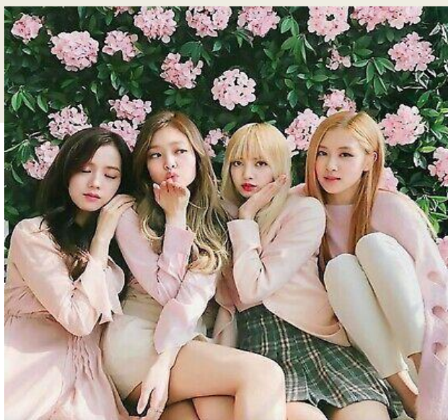
PODPIS DO OBRAZU