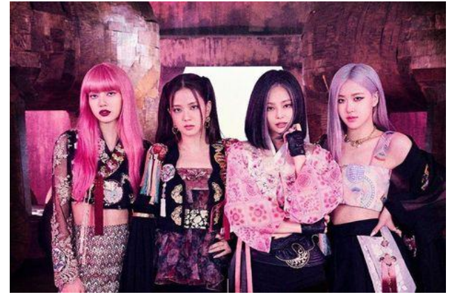
Blackpink na planie tworzenia "How You Like That"

Każdy kpopowy idol często mówi jakieś ważne cytaty które dają nam dużo do przemyślenia. Na wywiadzie po wydaniu utworu „How You Like That” dziewczyny wyjawiały że piosenka niesie ogromne przesłanie. Mianowicie to że nawet w najciemniejszych, najtrudniejszych chwilach powinniśmy wytrwać i walczyć i nikt nie powinien się poddawać. Blackpink chcą aby każdy dzięki im muzyce znalazł sobie siłę i wole walki, ponieważ jeśli chcemy tak na prawdę możemy osiągnąć wszystko. W piosence „How You Like That” Rose mówi „śmiej się ile chcesz, puki jeszcze możesz ponieważ wkrótce twoja kolej” co jest bezpośredni zwrot do hejterów którzy chcą je zniszczyć i zepchnąć na sam dół jednak one będą walczyć i pokarzą wszystkim swoją siłę.