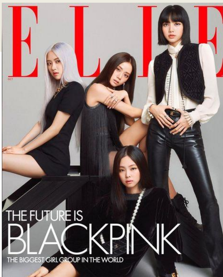
Dziewczyny z Blackpink zdobią nie jedną okładkę.