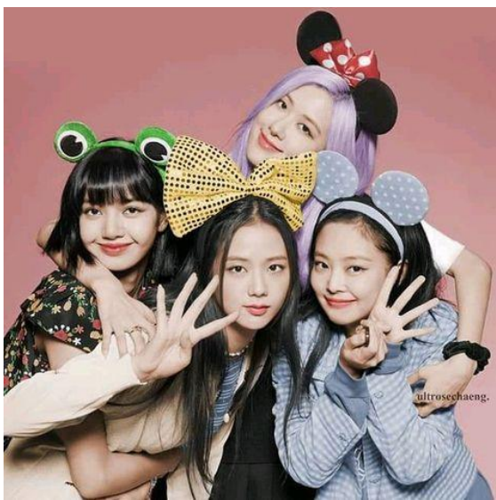
Nie tylko dobrze śpiewają, ale się dobrze bawią.

Grupa składa się z czterech członkiń: Jisoo, Jennie, Rosé i Lisy, które pochodzą kolejno z Korei Południowej, Australii i Tajlandii. Zadebiutowały z piosenkami, „Boombayah” i „Whistle”, z ich pierwszego singla (ang. single album) Square One.