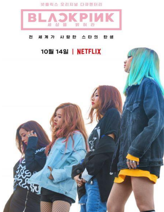
Plakat do filmu "Light Up the Sky".

Oryginalna lampka Lightstick BLACKPINK. Idealna dla każdego fana zespołu. Świetny gadżet na koncert. Pozwól się zauważyć! Jest ładny i oryginalny, gdy o coś nim uderzysz wydaje dźwięki. Jego cena wynosi od 150 do 300 złotych.